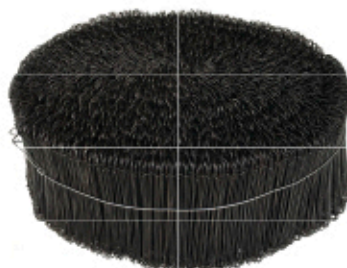
Ligature à 2 oeillets 02LIGO120 02LIGO140 02LIGO160