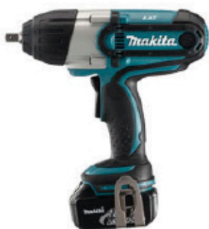
Boulonneuse à choc 11MAKBTW450RFE