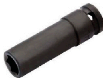
Douille impact 11OUTD1/2-IL-19 - 19 mm 11OUTD1/2-IL- 24 - 24 mm 11OUTD1/2-IL-30 - 30 mm