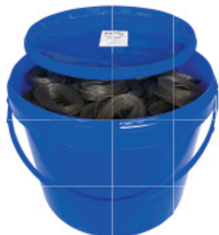
Seau de fil à ligaturer 20 kgs 02FILSEAU