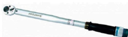
Clef dynamométrique 11Clefdyn