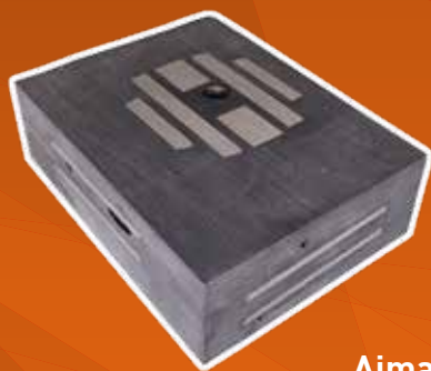
Aimants Bimavoile 02AIMBIM75100

Les aimants spécifiques de bimavoile permettent un positionnement facile et rapide dans le coffrage.