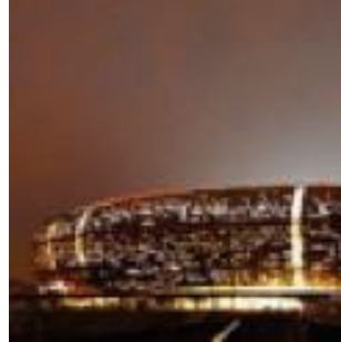
Soccer City Stadium Johannesburg (Afrique du sud) 2009