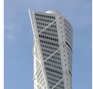
Turning Tower - Malmö (Suède) 2005