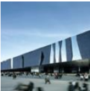
Forum des cultures, Barcelone, Espagne. Herzon & de Meuron