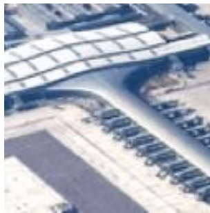
Barcelone Airport T1 (Espagne) 2008